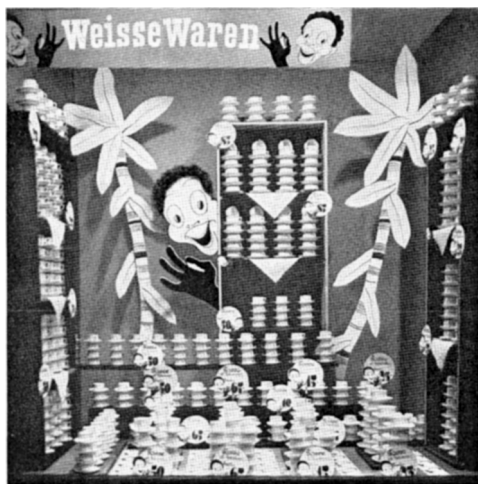
Ein Schaufenster der Filiale Basel