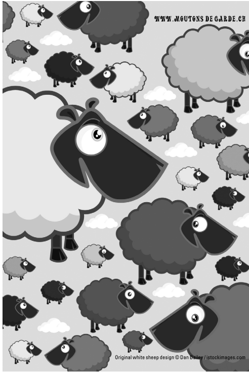
Abbildungen 3 und 4: Motiv des Vereins Moutons de Garde und Emblem des Festes gegen Rassismus