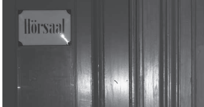
Bild 11, Serie „Gender-Rundgang“

Das Centre en Etudes Genre LIEGE, welches an der Faculté des Sciences Sociales et Politiques verankert ist, hat aber auch eine neue zentrale Mission: die Förderung und Entwicklung der Forschung im Bereich der Gender Studies an der Universität Lausanne. Erste wichtige Etappe in diese Richtung ist die Schaffung der Westschweizer Ecole Doctorale en Etudes Genre, ein dreijähriges interdisziplinäres Graduiertenkolleg, das am 1. Oktober 2008 seine Tore öffnete. Das Thema der Ecole doctorale, „Genderpraktiken und -perspektiven: Paradoxe der Gleichstellung“, wird anhand der vier Forschungsachsen „Intersektionalität von Geschlecht, Klasse und Rasse“, „Arbeit, Erwerbsleben, Erwerbslosigkeit“, „Migrationen, Mobilität, Zirkulation“ und „Körper, Sexualitäten und Fortpflanzung“ behandelt. Das Graduiertenkolleg vereint neben dem Centre LIEGE (Sitz) die Maison d'Analyse des Processus Sociaux (MAPS) der Universität Neuenburg, die Unité Genre der Universität Genf sowie das Institut de Hautes Etudes Internationales et du Développement (IHEID) in einer Partnerschaft. Es wird hauptsächlich durch das Förderprogramm ProDoc des Schwei-