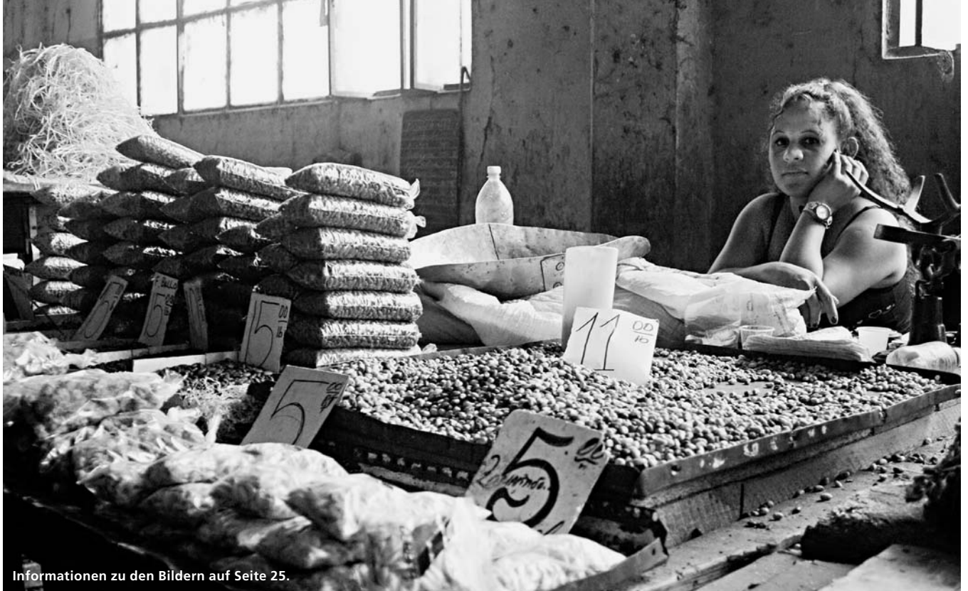
Informationen zu den Bildern auf Seite 25.

«In a society where the rights and potential of women are constrained, no man can be truly free. He may have power, but he will not have freedom.» (Mary Robinson 1 )